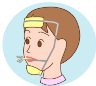
上あご前方牽引装置

一般的に、骨格性反対咬合は、低年齢で上あごの成長を促し、下あごの成長を抑えて上下のあごの前後差を改善する矯正装置を用います。この装置は、「上あご前方牽引装置」と呼ばれ、主に夜間装着してあごの